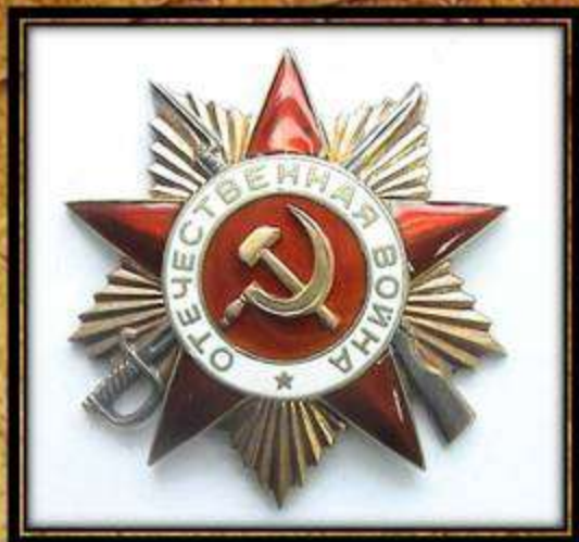
Орден Отечественной войны 1-ой степени