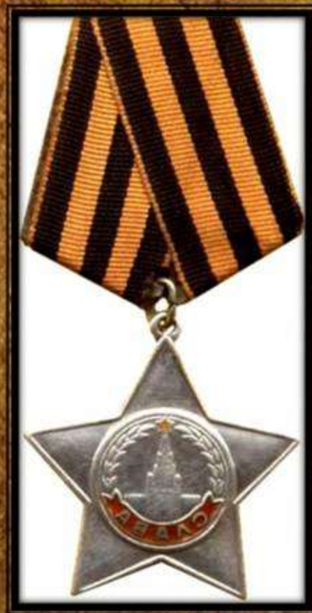
Орден Славы 3-ей степени