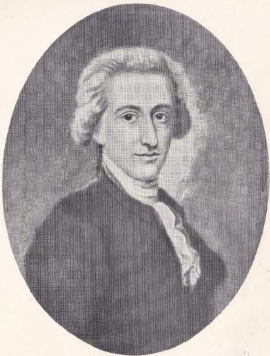
Портрет ГЁТЕ работы Ф. А. Барба. Масло. 1785 г.