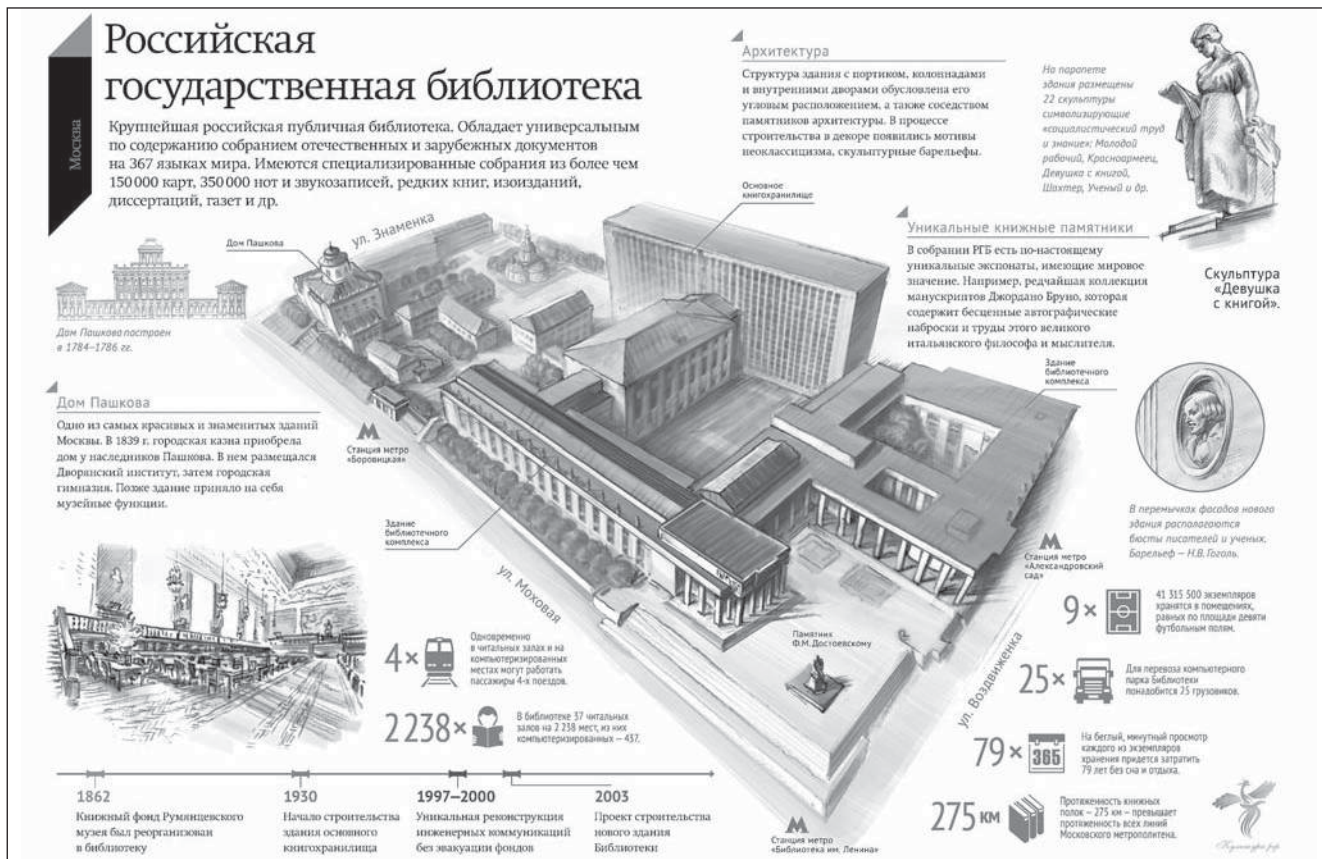
Рис. 2. Здание РГБ

Надо отметить, что создание подобного продукта – это коллективная работа, требующая немалых творческих усилий. Однако полученный результат того стоит. Изучая сайты библиотек России, я практически не встречала примеры использования инфографики. Исключение составили РГБ и Российская государственная библиотека для молодёжи. Очевидно, этот инструмент ещё плохо освоен в нашем профессиональном сообществе. Однако достоинства инфографики налицо, и перспективы у данного направления есть. Надеемся, что в ближайшем будущем библиотекари научатся работать с этой формой подачи информации и подобных продуктов станет значительно больше.