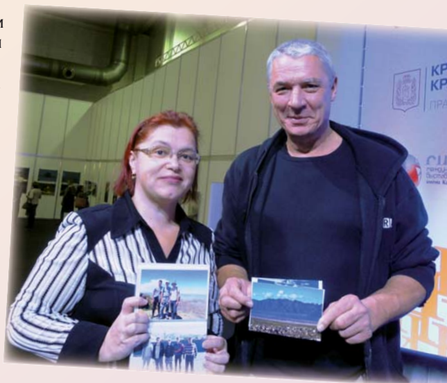
Андрей Стасюк признался, что его сердце принадлежит Сибири и Алтаю

Новое краеведение – это попытка найти новые музейные языки и формы представления локальной истории с тем, чтобы сделать место проживания заметным и ценным для жителей. Это осознание специфики территории и внимание