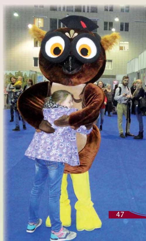
Гостеприимная и мудрая Сова обнимала всех детей