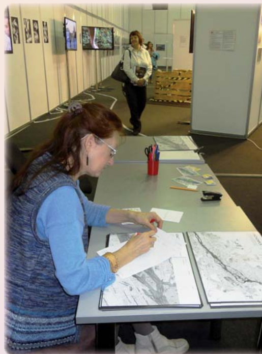
На заполнение карты по проекту «КОД ГОРОДА» потребовалось время

З начительная часть семинара была посвящена обсуждению опыта библиотек в краеведении. Библиотекари обсудили различные интересные вещи: конкурс медиа-экскурсий молодёжной библиотеки г. Дивногорска «Я люблю тебя, Дивногорск», проект Сосновоборского Библиотечно-музейного комплекса «Линия времени» (Time Line) и др.