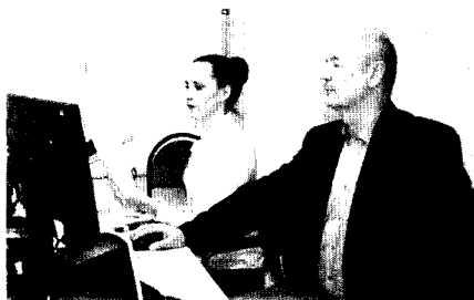
Озвучивание литературного журнала

Силами Молодёжного совета были озвучены первые выпуски звукового литературного журнала «Сура».