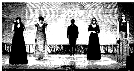
Открытие Года театра

Участники совета постоянно участвуют в телевизионных проектах, радиопрограммах, дают интервью, пишут статьи для профессиональной прессы, выезжают на профессиональные конференции, молодёжные форумы (Селигер, Таврида, Форум молодых библиотекарей и др.), участвуют в общественной жизни города.