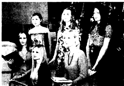
Новогоднее поздравление от библиотечной молодежи страны

Мы активно сотрудничаем с молодёжными объединениями разных городов и создаём совместные видеопроекты. Вместе мы поздравляли с 50-летним юбилеем Российскую государственную библиотеку для молодёжи, создали новогоднее поздравление от библиотечной молодёжи, с активистами Молодёжной секции РБА подготовили юбилейный выпуск журнала «Молодые в библиотечном деле», а также праздничный видеоролик в подарок главному редактору.