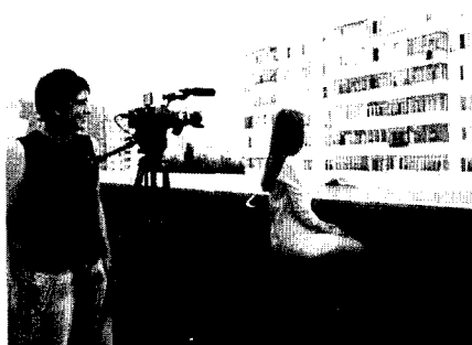
Съёмки на крыше библиотеки