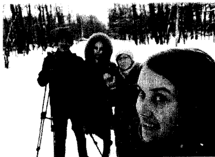
Съёмки на морозе