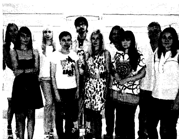
Совет. Лето 2014 года

С переездом в новое здание изменился и стиль совета. Мы поменяли логотип, сделали его более стильным, узнаваемым, приближенным к фирменному стилю новой библиотеки, выполненному в золотисто-зелёном цвете.