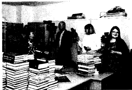
Съёмки промо-ролика к Библионочи