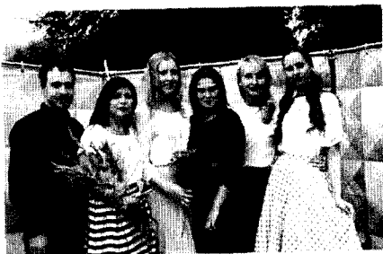
Международный фестиваль «Театральные эскерсисы»

Ежегодно к новогодним праздникам Совет делает подарок гостям библиотеки и посетителям сайта и наших соцсетей. Так, в 2018 году мы выпустили календарь с цитатами из литературных произведений. Героинями страниц календаря стали участницы молодёжного совета. В прошлом году в честь своего 10-летнего