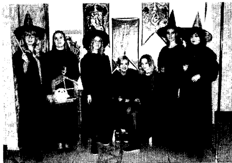
Всемирная Ночь Гарри Поттера

Заметим, что все эти активности внеплановые. Это исключительно желание членов Совета создать что-то новое и интересное. Даже если ради этого порой нужно залезть на крышу библиотеки (именно там снят трогательный видеоролик «Любовь между строк», где ресурсы Лермонтовки показаны сквозь призму романтической встречи), уехать на десятки километров, чтобы снимать чтение стихов Михаила Лермонтова, пусть даже в двадцатиградусный мороз или устроить ночные съёмки Купальской ночи на озёрах. Конечно, это требует сил, выдержки и стойкости, но зато незабываемые впечатления о съёмках останутся с нами на всю жизнь.