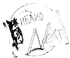
Логотип 2008 года

После поездки было принято решение организовать в библиотеке своё молодёжное объединение. Тогда же были придуманы название совета — «БиблиоNEXT» и логотип.