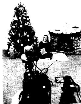
Снимаем «Новогодние истории»