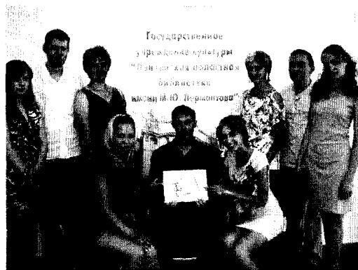
Совет. Лето 2009 года