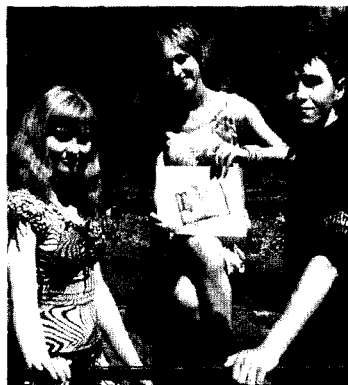
Лето 2009 года